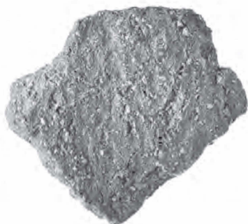
図54 高台瓦窯で採集した胎土にクサリ礫を含まない瓦片

平瓦については、5cm角以上残存する資料は、高台瓦窯で17点、峰寺瓦窯で32点である。高台瓦窯では、AとCが6点と最も多く、続いてBが4点、Dが1点確認できた。一方、峰寺瓦窯では、もっとも多い調整手法はCで16点あり、次にBが10点、Eが3点、Aが2点、Dが1点と続く。側縁が残るものはすべて、分割破面が残らないc手法だが、凸面と側縁の作る角度が鋭角になるものと鈍角になるものが確認できた。また、凹面側をヘラ削りするものや、わずかだが断面形状が剣先形になる側縁もみられた。ただし、側縁手法と凸面調整手法との相関性はみられなかった。なお、分割界点の残る資料が1点確認できた。胎土・焼成・色調は丸瓦と同様である。面戸瓦 峰寺瓦窯で2点確認した。図53-2は袖部から舌部にかけての破片である。凸面の調整手法はBで、縄