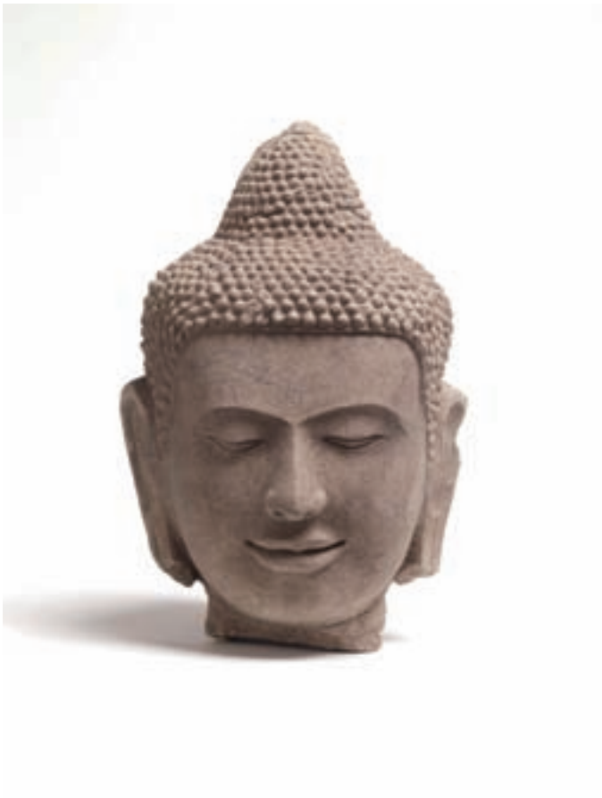
11次調査で発掘された仏像の頭部 Unearthed Buddha's head in the 11 th investigation

A bronze ring, a glass bead, some gold leaves, and an anonymous silver artifact