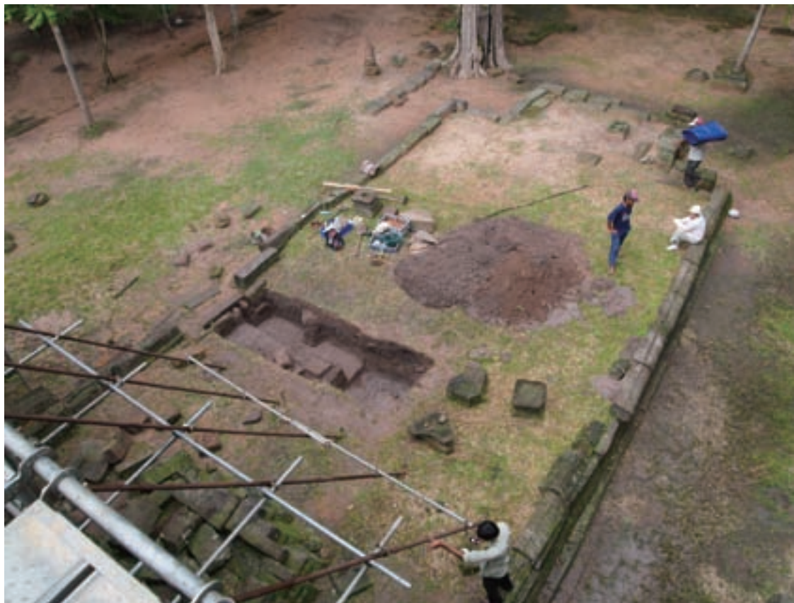
仏教テラス上の発掘区：第12次調査（南西から）

Excavated area on the Buddhist Terrace in the 12 th investigation (from the southwest)