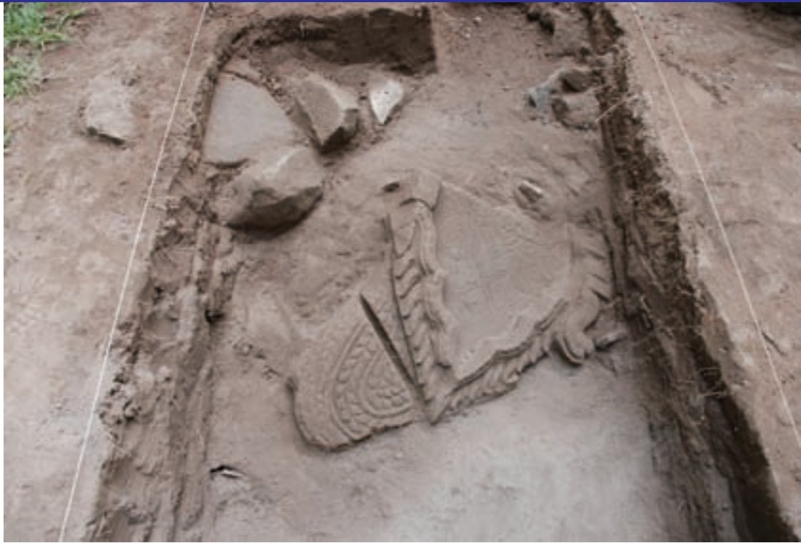
仏像の頭部（左上）および光背部（中央）出土状況：第11次調査 仏像の頭部は下を向いており、表情は見えない。

Unearthed Buddha's head (upper left) and the parts of Buddha's halo (center) in the 11 th investigation