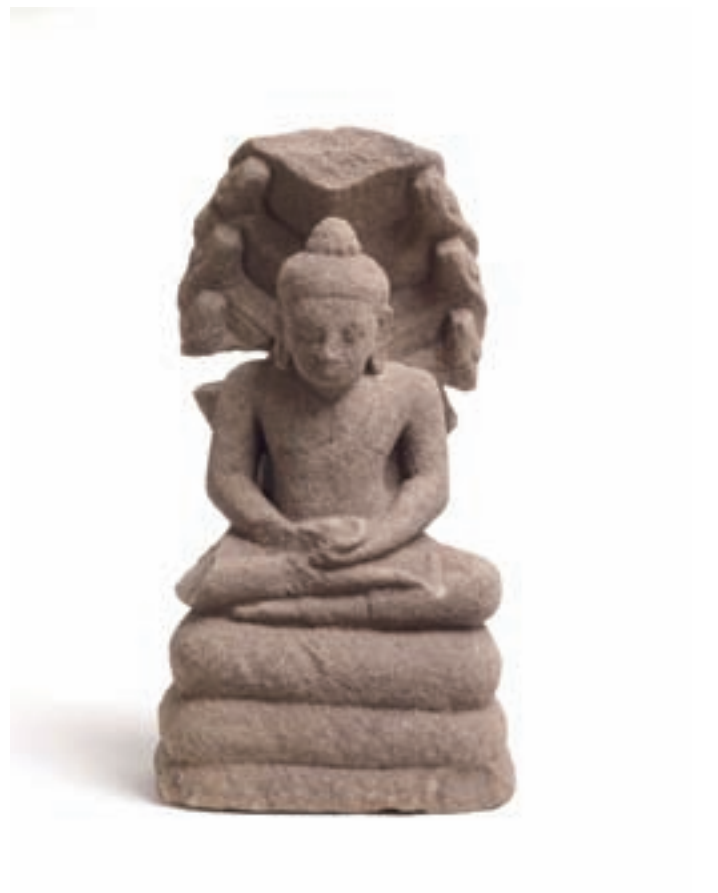
12次調査で発掘された仏像 Unearthed Buddha's statue in the 12 th investigation