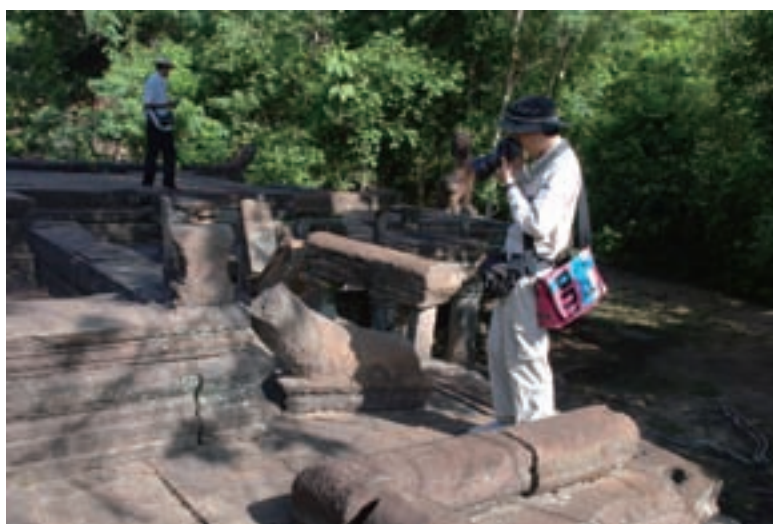
他の遺跡の類例を調査する