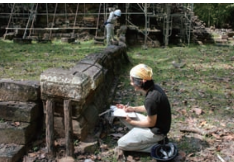
巻尺を用いて各部材を手測りする

Horizontal plan of Western Prasat Top is shown on the next page. At first viewing the North and South Towers are erected bilaterally; however, you can see the difference of their designs in the horizontal plan. We can examine the structure of construction in detail, based upon precision measured drawings.