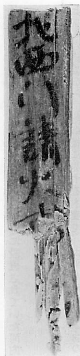
第 2 図

外正六位下生部直 (信託) □□理は、天平十年二月の駿河国正税帳にみえる郡司少領外従八位上壬生直信陀理と同一人物ではないかと思われる。