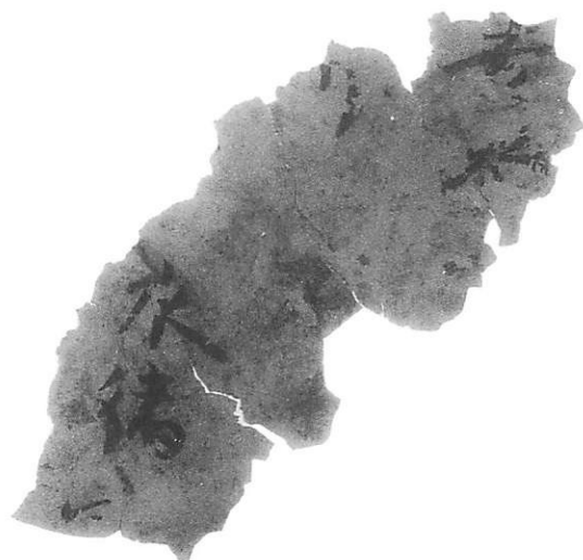
平城宮第93次調査出土漆紙文書A)

本文書は漆のパレットに用いたと思われる直径12.6cmのクロメ漆付着の土師器の椀A（平城宮土器IV）を覆っている。紙自体の遺存状況はきわめて悪い。墨痕はオモテ面に2行分認められ、釈文は別掲のとおりである。残