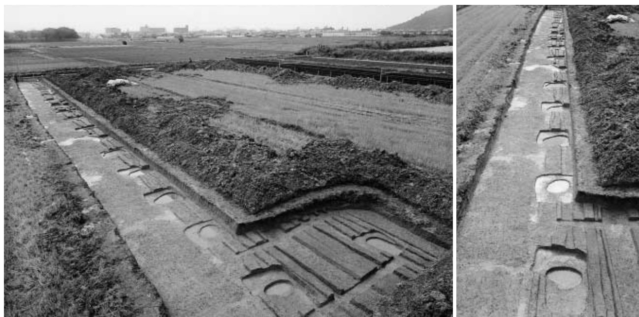
図62 掘立柱建物SB9410 (左:南東から、右:南側柱列 東から)