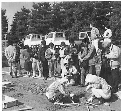
発掘調査現場(第194次)の見学風景