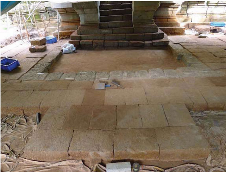
最下段（N25）の石材を再構築した段階の南祠堂 （2014年12月はじめ：南から） The lowest stones (N25) were reassembled at the Southern Sanctuary (in early December 2014: from the southwest)