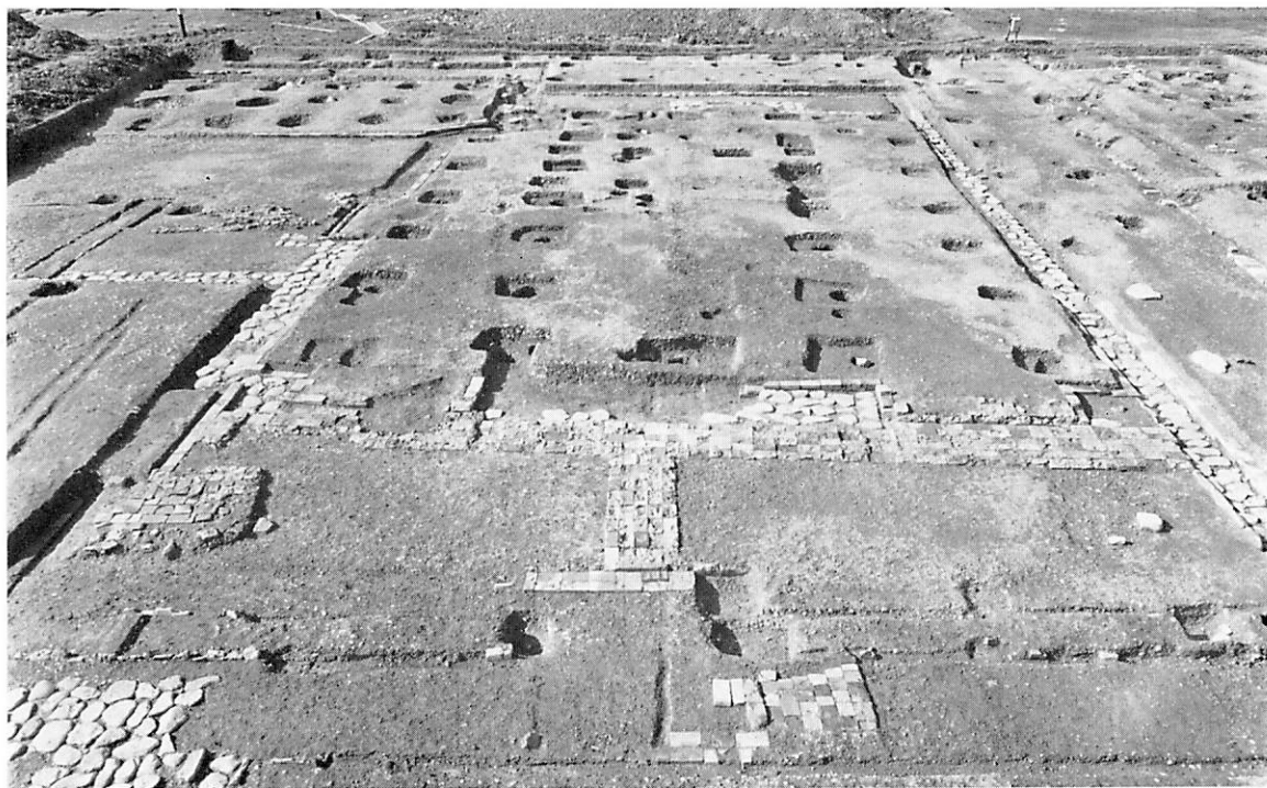
平城宮跡磚積基壇 第38次調査地区