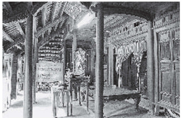
図17 民家の内部（図14の123）

板壁や斜梁持ち送り、母屋などに彫刻が豊かなものの編年指標としにくく、建築年代も大半は明確でない。聞き取りの成果によって多くは18世紀後期～19世紀前期頃の建築と考えられるが、上記の構造の違いなどを考慮して編年観を詰めていきたい。（箱崎和久）