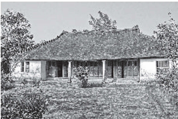
図16 民家の外観（図14の122）

内部の空間構成は、中央部の主室とその両脇の脇室からなる。ただしその構成は若干複雑である。主室は身舎背後の柱筋から正面側の桁行3間×梁行3間と、それらより背面側の桁行中央間×梁行2間からなり、平面凸字形をなす。背面側に突出する部分には先祖壇を置き、正面側は接客空間とする。それ以外の主屋両端部にL字形にできる脇室は、正面向かって左側を男性の寝室、右側を女性の寝室とし、そのうち背面側は倉庫としても用いる。脇室の正面側桁行2間分は、主室との間に梁行方向に間仕切りを設ける場合と、桁行方向に間仕切りを設けて、主室と一体化してしまう場合とがある。図17は後者の例だが、間仕切りはなくてもベッドなどを置くため、空間的な区別はあるらしい。