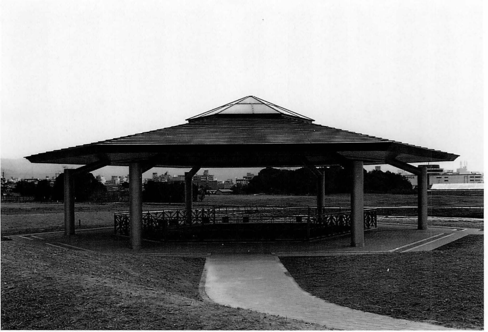
平城宮造酒司六角形井戸屋形覆屋