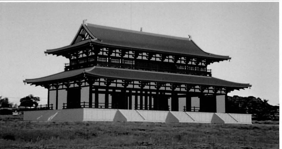
コンピューターグラフィックスによって復原される第一次大極殿