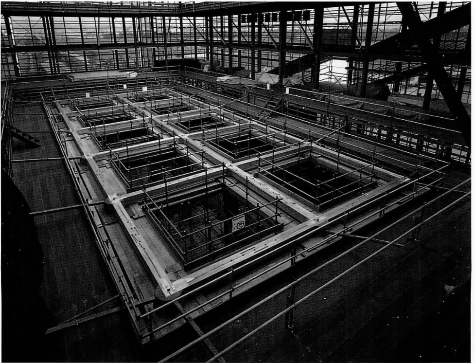
朱雀門復原工事 一重の柱を立て、その頂部に頭貫を組む