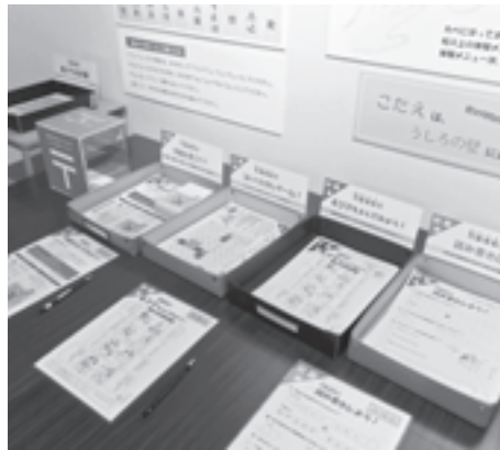
図7 万葉仮名の体験(秋期企画展)