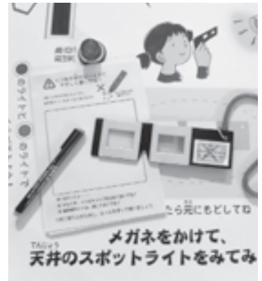
図8 注意事項の表示(考古科学コーナー)

掘速報展・考古科学コーナーともに、ひとつの体験展示に極端に人気が集まるということはなく、さまざまな体験コーナーに分散している。そのなかでも人気が高いコーナーは、視覚的にインパクトのあるものや、体験の達成感が高いものが多いといえる。