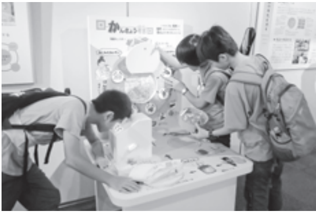
図3 考古科学コーナー 子ども向け体験仕器