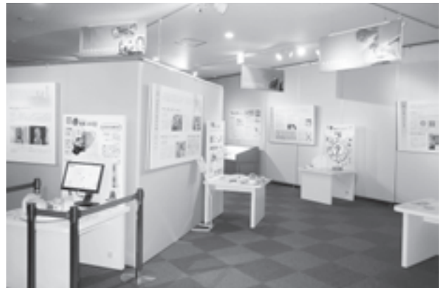
図1 考古科学コーナー

究・保存に活用されているか、具体例をあげて紹介することで、自然科学系博物館の展示と差別化を図る。