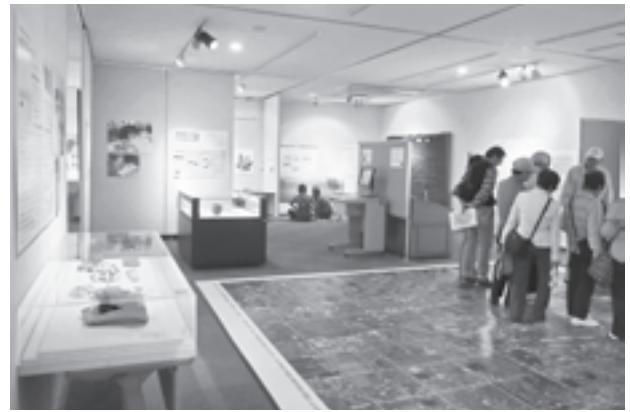
図4 春期企画展のようす

秋期企画展「地下の正倉院展—コトバと木簡」(2011.10.18～11.27) 年に1度の本簡の特別公開展示。本年度は、木簡に書かれた「文字」に焦点をあて、語順や万葉仮名、書きぶりや字体、合わせ字など、万葉びとが中国の文字「漢字」を習得し、使いこなしていった努力と工夫の跡