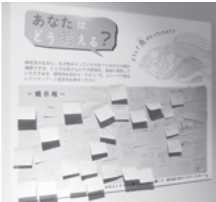
図6 鎮壇具のアイデア掲示板(春期企画展)