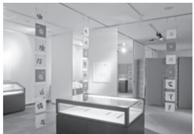
図5 秋期企画展のようす