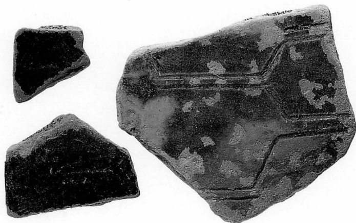
平城京左京二条二坊十一坪 (第279次) 出土の二彩蓋 ゆるやかな曲面をもつ二彩 陶器の破片で、軟質の素地 に濃緑と白の二彩が施され る。凸面側に刻線で亀甲文 をあらわしている。鉛釉陶 器での類品をみないが、平 城宮出土の須恵器硯の蓋に、 亀甲文を施した同工の製品 がある。 本文48頁参照