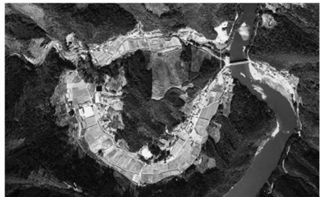
図63 下津井地区 (1998.3、高知県清流環境課)