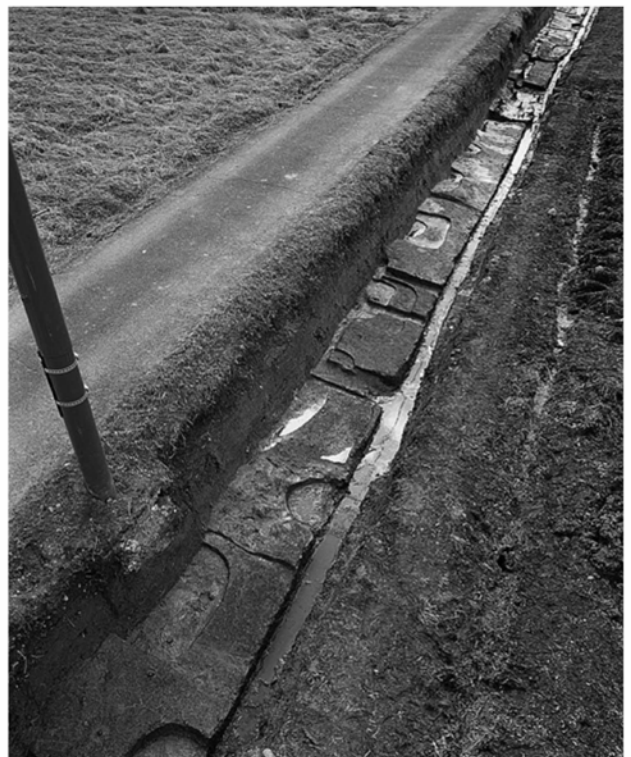
図81 SB10750検出状況(北西から)