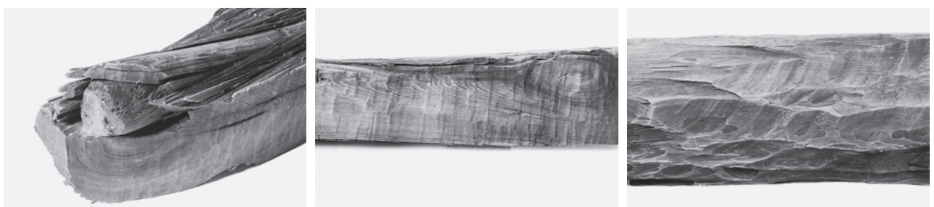
木材1 木口に打ち込まれた小杭