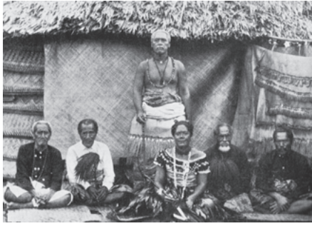
図34 ファインマットと首長たち 3)

と呼ばれるファインマットと、オロア財（男性財）と呼ばれるブタ・タロイモなどの食料や道具類とがそれぞれ交換されていたが、現在ではオロア財として現金が用いられるようになった。そのため、大量に流入した現金と交換する対価として、大量のファインマットが必要とされるようになった。