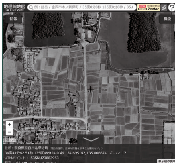
図3 地理院地図を用いた位置情報の取得(国土地理院)

遺跡の位置を記す方法は、遺跡の所在地が一般的だが、緯度経度も同時に記すことをお勧めする。遺