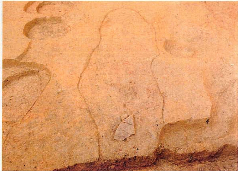
焼土と炭の入った溝 (南東から)