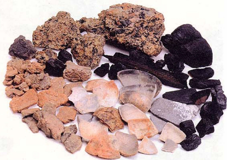
焼土層出土遺物 (1994年調査)