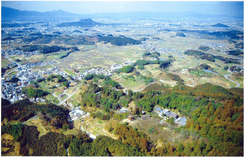
狹義の飛鳥の地を南東上空より望む（小澤論文参照）