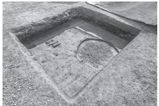
図271 第594次調査区全景(北西から)