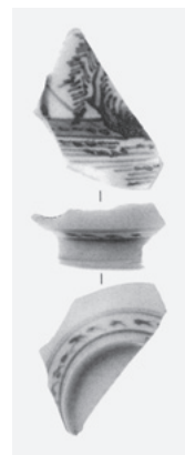
図73 出土染付磁器 1:2