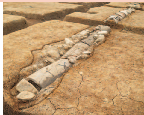
丸瓦を連ねた暗渠(溝1、北東から) ※瓦の内外に礫を詰める