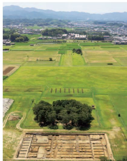
藤原宮の中枢部と今回の調査区(北から) ※手前から調査区、大極殿、朝堂院