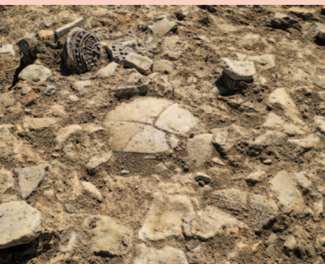
基壇北方に広がる瓦堆積(瓦堆積1、北東から) ※礫敷上に大振りの瓦が散乱する