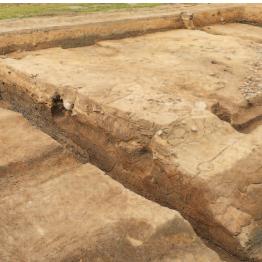
調査区西南部で検出した基壇(北東から) ※版築状に積み土をする