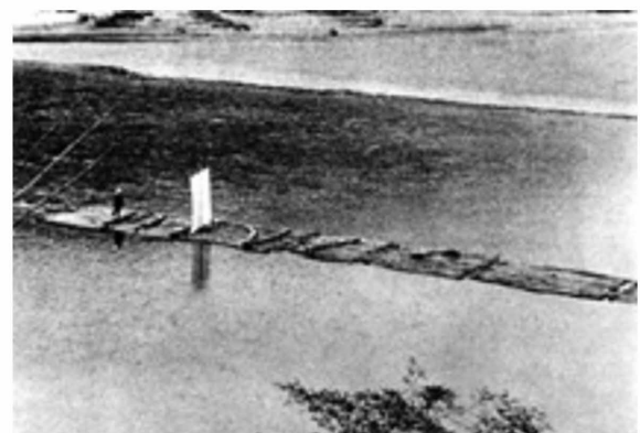
図3-10 四万十市江川崎附近での筏流し（昭和12年） 9)

明治から昭和初期にかけて見られた筏は、多くが四万十町大正地域（旧大正町）から四万十市西土佐地域（旧西土佐村）にかけての国有林や民有林から切り出されたものである。途中、四万十町久保川口