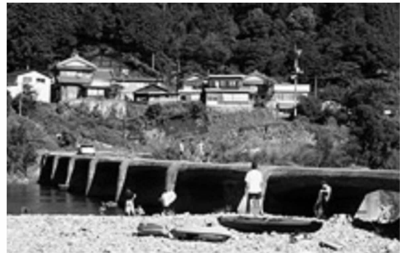
図3-15 カヌー発着場としての利用（四万十市口屋内）

失を防ぐため、橋板の一方の端をくり抜いてシュロ縄を通し、そのシュロ縄を周辺にある岩や樹木に結びつけていた。橋板が流された場合は橋台の上部が水面に現れる程度まで水が引くのを待ち、その時点で地区の男性が集まり橋板を上流まで戻す。まず、橋板の一方（下流側の方）を手前の橋台に固定し、もう一方を水に流しながら対岸の橋台まで渡す。これを徐々に持ち上げて橋台の上に乗せて復旧させていた。このような手順で行われるため、橋が流される毎に橋板は180°回転した。