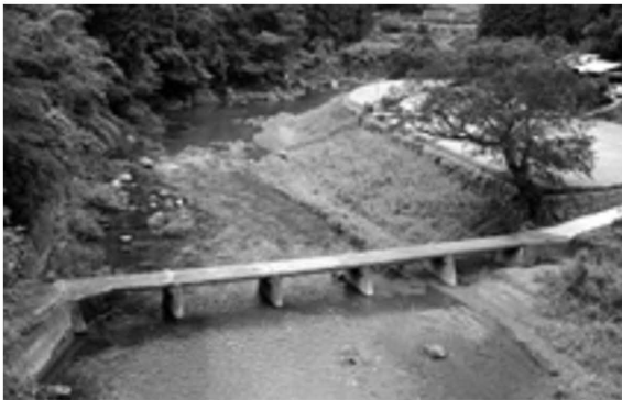
図3-14 一本橋の橋桁を結んだエノキ（梶原町竹の藪）