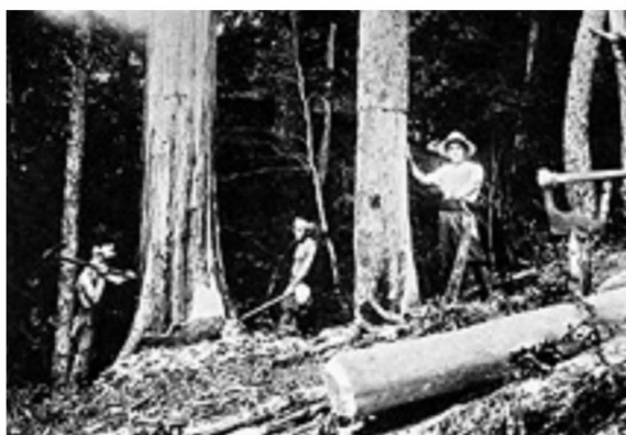
図3-1 天然林の伐採(森ヶ内、大正12年) 1)

四万十川流域での国有林野事業 四万十川流域で林業が盛んになるのは、官行斫伐事業が着手されたことに始まる。官行斫伐事業とは製品生産事業のことで、伐木から商品材までの加工や、それに伴う副産物、木炭、板などの製品化を一貫して行った。明治41(1908)年には四万十町松葉川山に森ヶ内事業所が設置され、その後、中土佐町の島ノ川や四万十町の北ノ川、大道、四万十市の黒尊や藤の川などに次々と官行斫伐事業所が開設された。だがこの当時は従来どおり木立のまま民間業者に売却されるのが主で、国有林へ続く道は荷馬車や荷車が通行できるものさえ少なく、施業体制の充実とともに、山林からの搬出経路の確保が求められた。