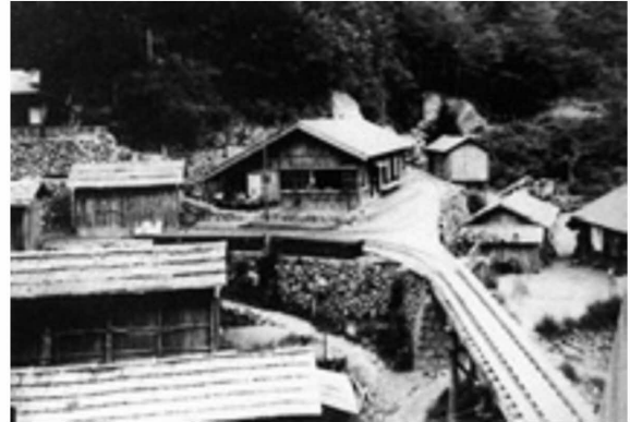
図3-5 藤の川官行斫伐事業所（昭和10年頃） 4)