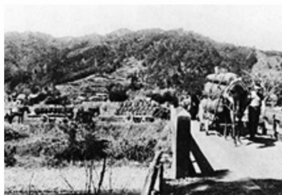
図3-2 荷馬車による輸送(久礼付近、大正12年) 2)