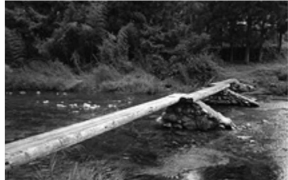
図3-13 「早瀬の一本橋」のわろう（津野町芳生野）