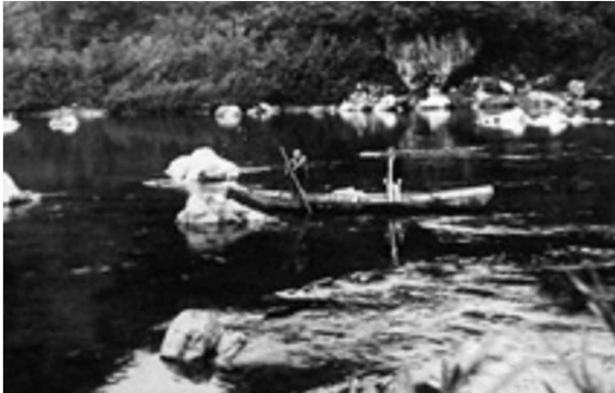
図3-12 四万十町十川の渡し（昭和初期） 13)