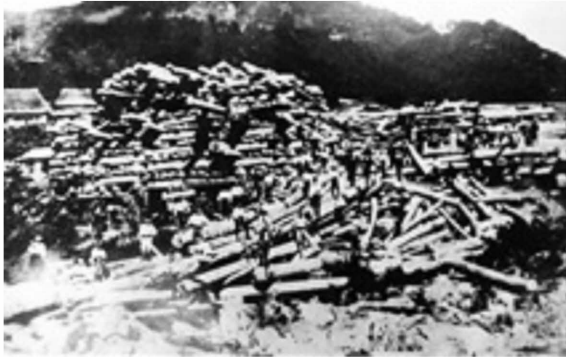
図3-4 中津川からの材が集まる大奈路土場（大正期） 3)