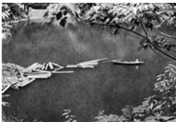
図3-9 四万十町下津井附近での管流し（昭和20年） 8)

菅流しで流した材と水を溜めてから一気に下流まで押し流す方法がとられていた。こうした搬出方法は「堰出し」や「鉄砲堰」、「鉄砲流し」などとも呼ばれ、水力利用形態の一つであった。