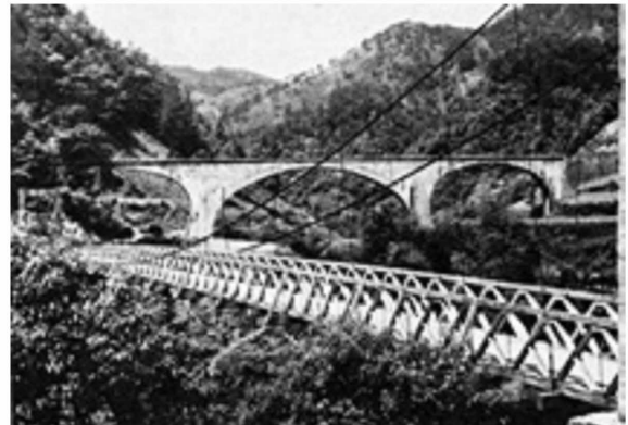
図3-7 大正林道下津井線の佐川橋（昭和20年頃） 6)

前は、木材は製品に加工して人の背で久礼港へ出荷するか、もしくは木材として冬場に下田港へ流すといった方法がとられていたが、開通後はほとんどが材のまま荷馬車で久礼港まで運ばれるようになった。