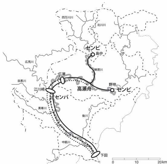
図3-11 舟航区間と中継地の関係

四万十川は木材搬出だけではなく、四万十川流域からの林産物の搬出にも川は大きな役割を果たした。特に明治時代に入ると木炭や泉貨紙などの需要が多くなり、舟運が活況を呈するようになった。