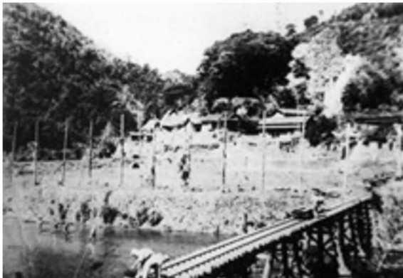
図3-6 黒尊川口に架かる黒尊林道の軌道橋（昭和初期） 5)