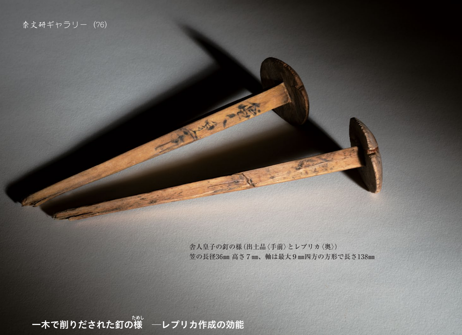
舎人皇子の釘の様 (出土品〈手前〉とレプリカ〈奥〉) 笠の長径36mm 高さ7mm、軸は最大9mm四方の方形で長さ138mm