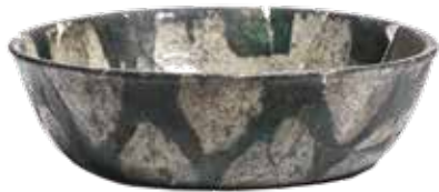
西大寺出土 奈良三彩

西の大寺 おおでら 、西大寺、そしてひとびとの記憶から薄れつつある西隆寺の歴史に思いを馳せていただけますと幸いです。