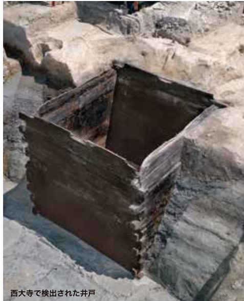
西大寺で検出された井戸