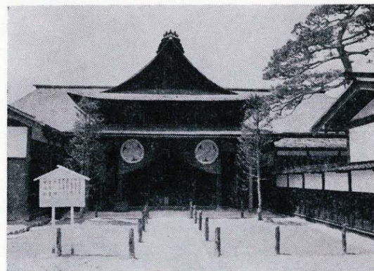
1-3 高山陣屋 上 表御門 下 御役所