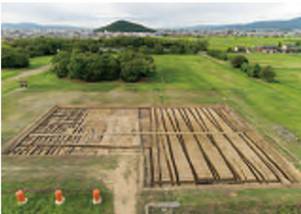
調査区全景(南から)

藤原宮の周辺では、朱雀大路や周辺の造成とともない改葬したとみられる日高山横穴や、日高山1号墳等があり、藤原宮朝堂院地区では古墳の周溝も見つかっています。今回の調査で発見した古墳とあわせ、宮造営以前の景観を考える上で重要な手がかりとなります。(都城発掘調査部 森川 実)