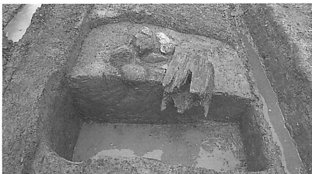
図9 西面大垣SA258の柱穴と礎板 北から

西面大垣SA258について、礎板の残る南から2番目の柱穴と根石らしい石の残る北から5番目の柱穴から、柱間寸法と柱列の方位を算出しておく。前者の推定柱心の座標値は X = -166,816.50 、 Y = -17,881.15 (最小計測単位5cm、以下同じ)、後者は X = -166,779.00 、 Y = -17,881.45 であり、柱間寸法は2.68m、柱列の方位は N 0 度 27 分 30 秒 W の値を得る。この数値は西面南門南方の第10次調査で得られた西面大垣の柱間寸法2.66m、方位 N 0 度 31 分 00 秒 W と近似しており、同時期に計画・施工されたことを裏付ける。 (毛利光俊彦)