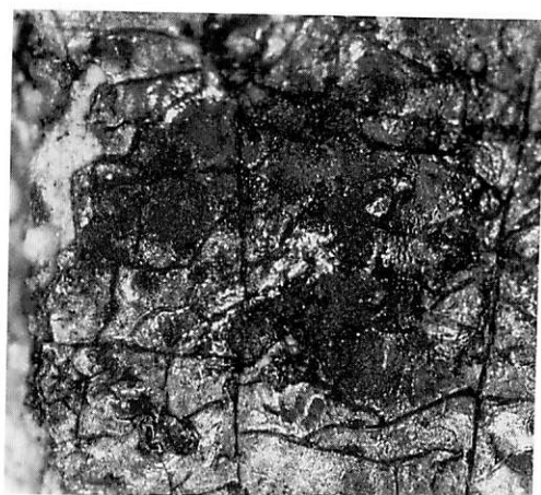
坩堝片に残存するガラス原料