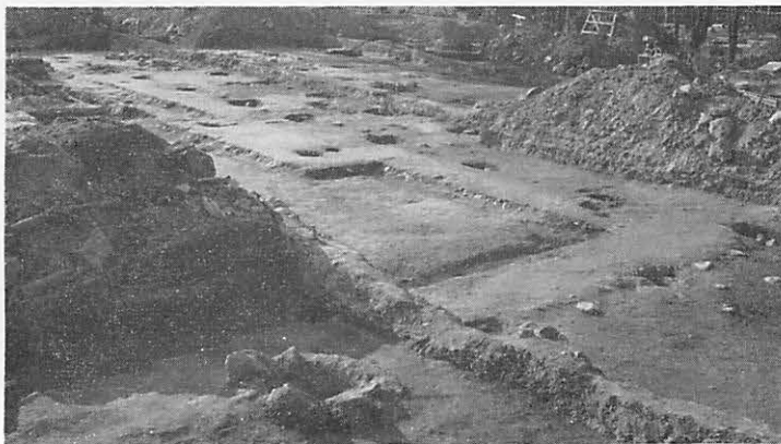
第1図 調査地域全景

寛永焼失面の下には焼層が2〜3層あつたので各焼層ごとに遺構を追求した。北部では東西に連なる小磔敷の雨落溝を検出したが、この溝底から