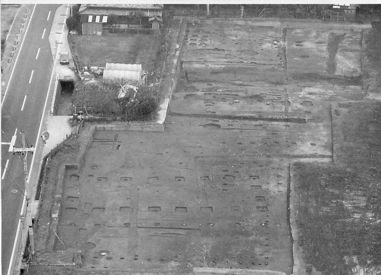
2 上 藤原宮第49次(右京七条一坊)調査区(北東から)