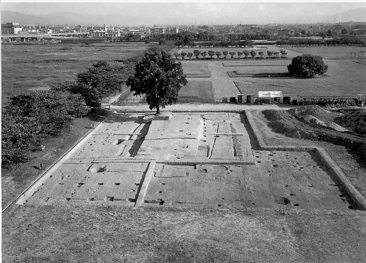
4 上 平城宮第一次朝堂院南門東側地区(東から) 下 同第二次朝堂院東第二堂(北から)