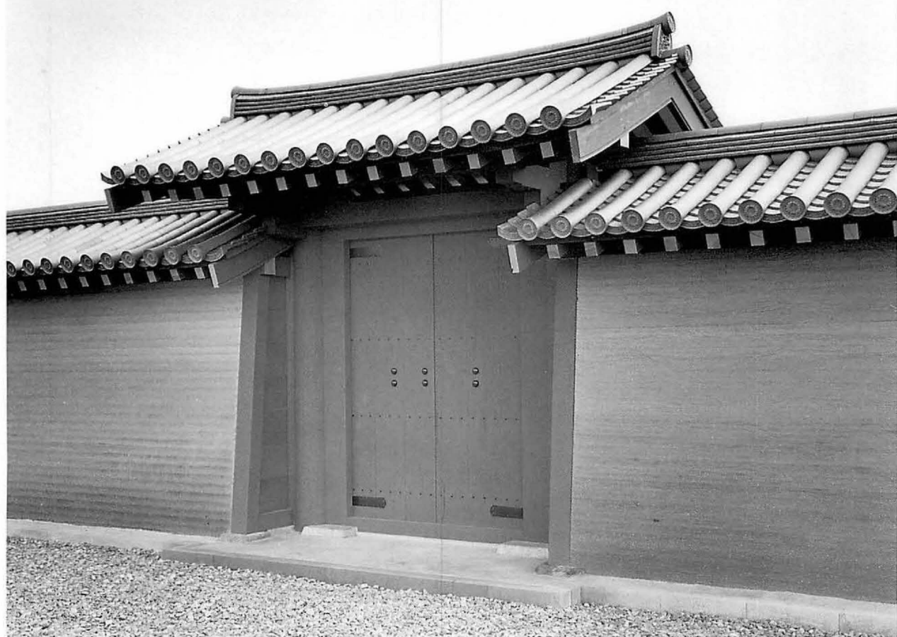
7 上 出水の酒船石(模造) 下 平城宮跡の整備 復原なった宮内省北門