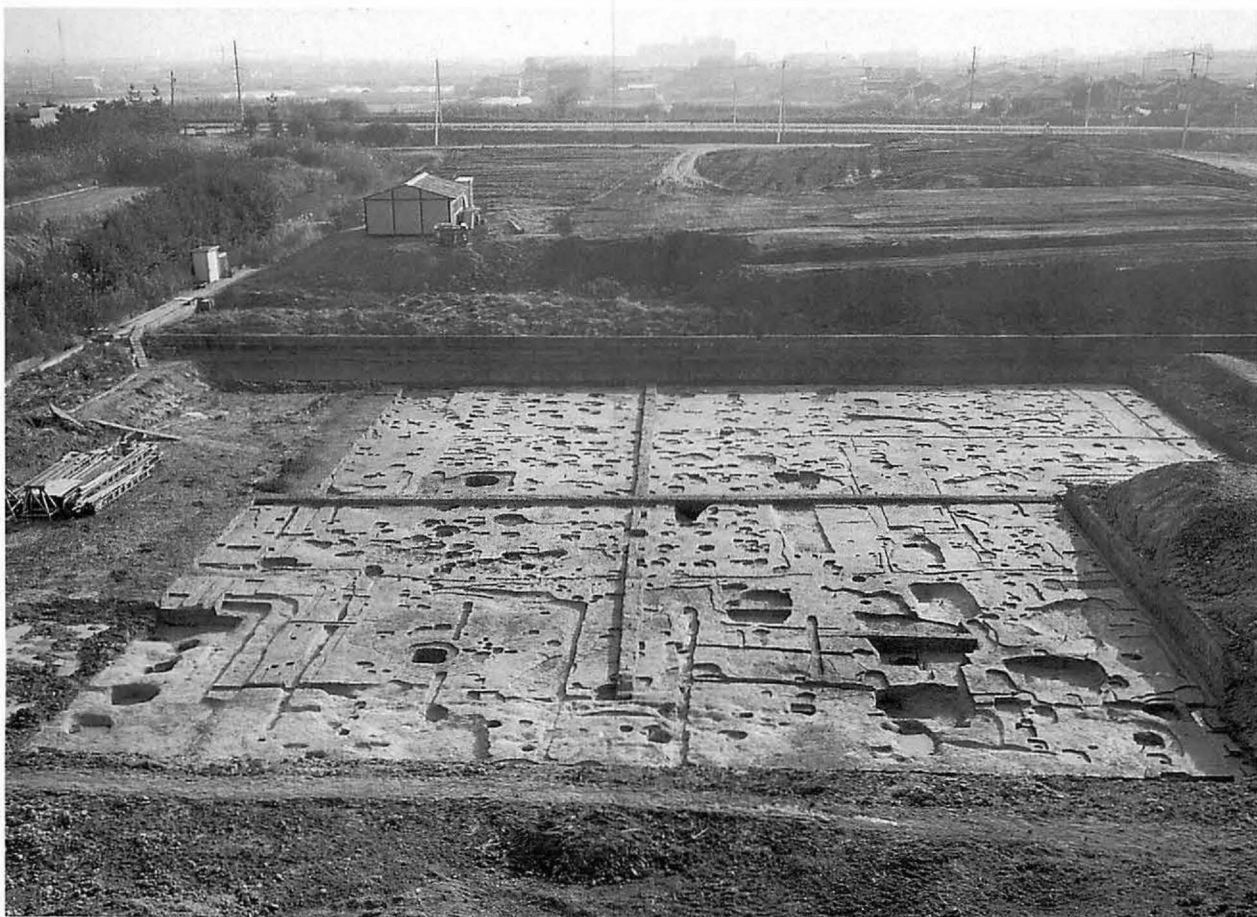
5 上 平城宮東大溝地区(南から) 下 平城京右京八条一坊十四坪(北から)