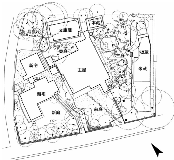
図86 庭園の全体構成と建物配置 1 : 1000

奥庭 主屋「うらざしき」と文庫蔵に挟まれるように築造された奥庭は、庭池のように自然石を組み並べた前栽と、ウメ( Prunus mume )を主木として植栽した中坪的な空