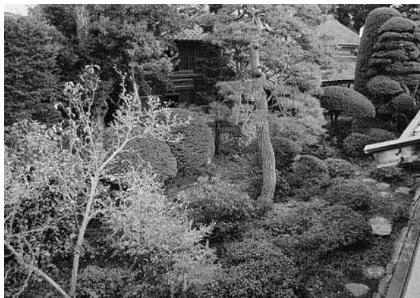
図87 主庭の現況 北西から