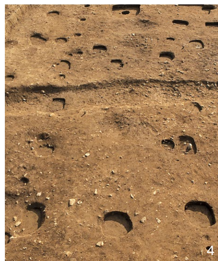
1. IV期の総柱建物SB5050 東から 2. VI期の建物SB5030、SA5032 北から 3. VI期の大溝SD4744・4745・4755 南から 4. IV期の建物SB4987 北から