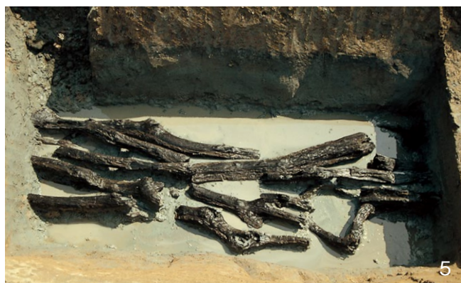
1. 東西大溝SD4130東端 東から 3. VI期の建物SB5925 北から 5. I期の自然木集積SX5922 北から