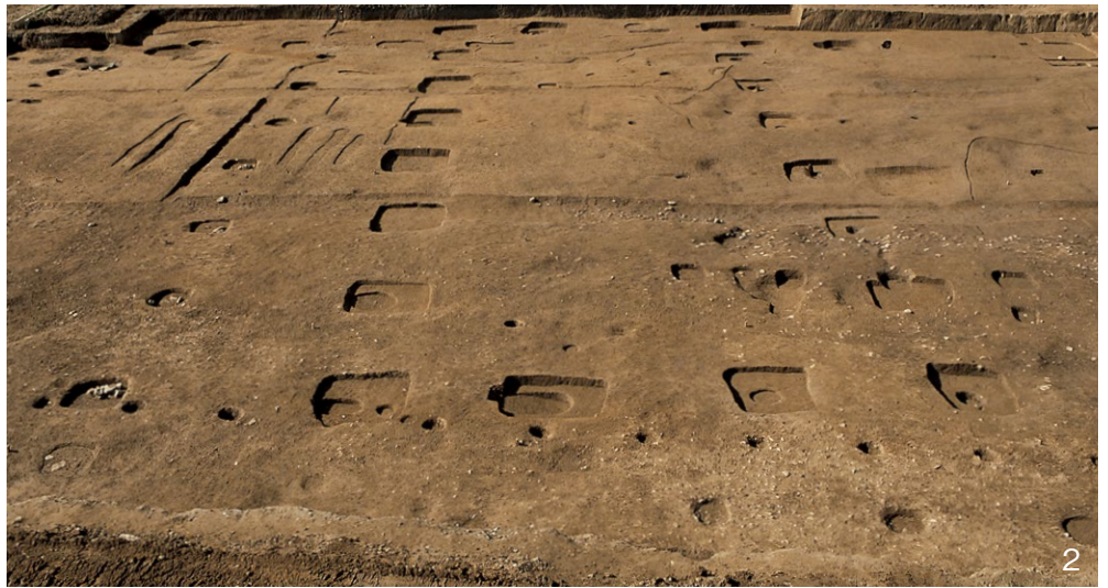
2. Ⅲ-B・C期の正殿 SB5000 東から