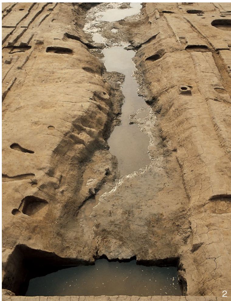
1. 東西大溝SD4130土層 東から 2. 東西大溝SD4130 東から