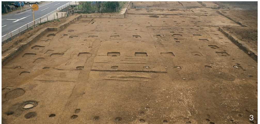
3. Ⅲ-B・C期の正殿 SB5000 南から