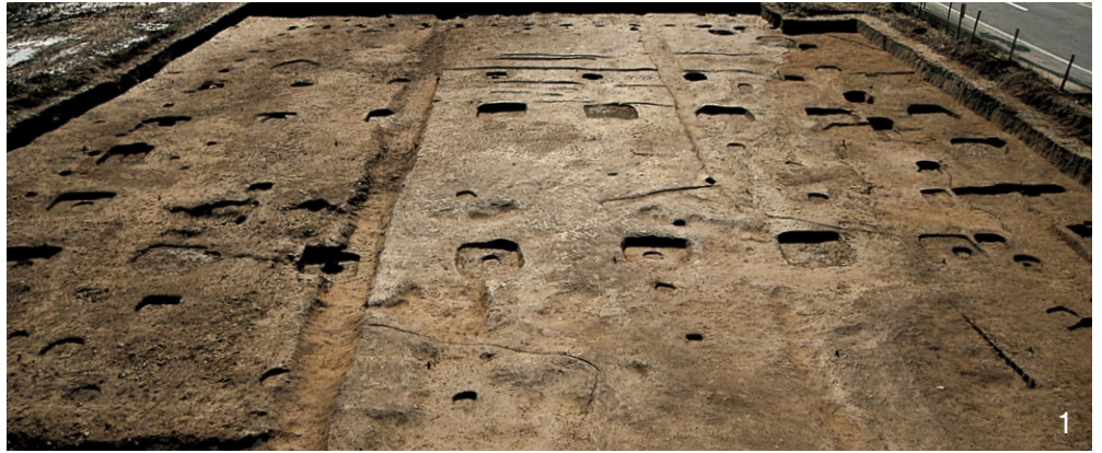
1. Ⅲ-B・C期の正殿 SB5000 北から