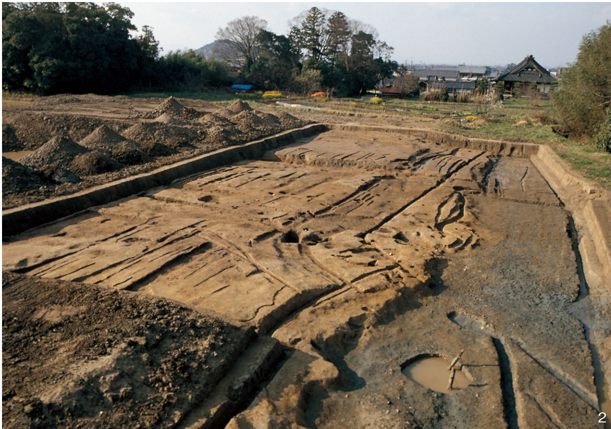
1. 北調査区・中調査区全景 南東から