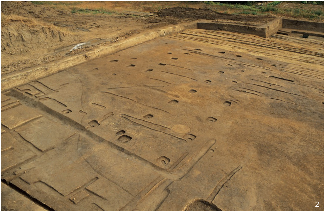
1. 調査区全景 南東から