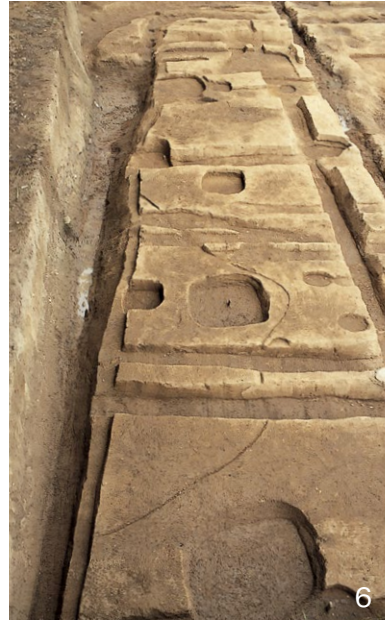
1. IV期の建物SB4560・4728・4727 西から 2. IV期の建物SB4787 南から 3. III-A期の堀SA4760、IV期の建物SB4786 北から