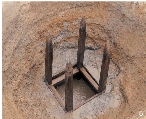
1. 東西大溝SD4130、井戸SE4740 西から 2. 井戸SE4740上層の石敷 東から 4. 井戸SE4740井戸枠 南東から