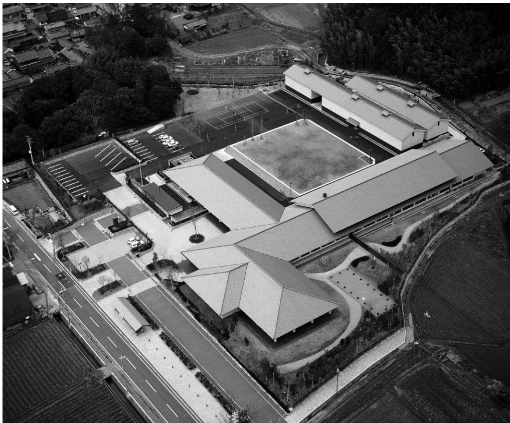
Fig. 306 完成した新庁舎 (南西上空から)

その後、1989年6月には公開部門の展示室が「藤原宮跡資料室」として開室した。1990年度には、遺構・遺物の保存処理および保存科学研究のための実験・処理棟が完成し、必要な設備を設置した。さらに出土遺物の増加から第二収蔵庫の新営を計画し、1995年度の補正予算により全体計画の南半分を竣工した。残りの半分は2004年度に事前調査を実施し、2005・06年度に増築した。