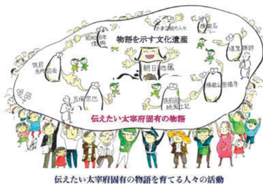
図4 太宰府市民遺産のイメージ

文化財が地域の財産として伝えられるもうひとつの理由は、文化財の中には地域のこれまでの多くの人々の思いや気持ちが詰まっているからであると考えられる。これを伝えることが文化財の重要な役割であると思うのである。地域を考えたり、顧みたり、思い出したりするときに必要なものなのであり、それが文化財の価値のひとつであり、地域づくりへの活用の源泉であると考えられる。