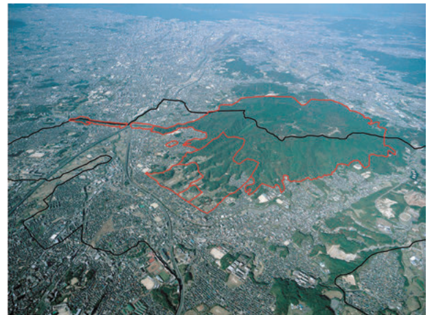
図2 大宰府関連史跡の位置（赤線、黒線は市境、南東から）

当市は歴史的にも有形文化財をはじめ多くの文化財が存在していたが、福岡都市圏の一部となり開発圧力も高かったために大宰府関連史跡を中心とする史跡の保護と開発に伴う埋蔵文化財発掘調査が文化