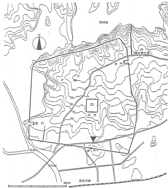
多賀城跡第44次調査木簡出土地

今回木簡が出土したのは、外郭南門と政庁南門とを結ぶ道路跡の検出を目的として実施した第四四次調査である。調査の結果、政庁