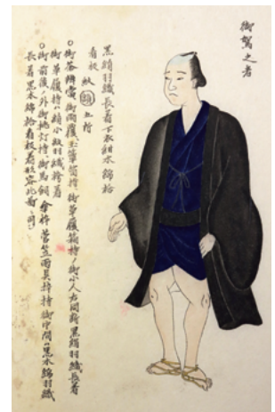
図5 同 御駕籠之者