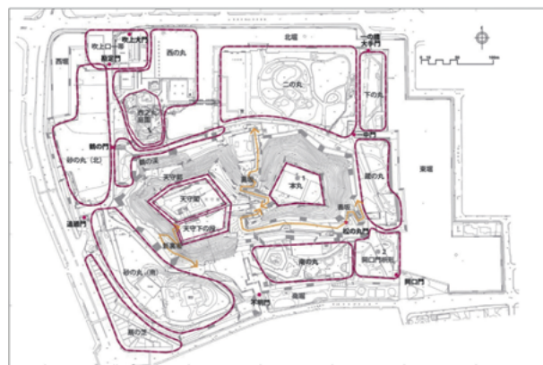
図1 史跡和歌山城概要

嘉永3年（1850）に再建された天守閣は明治維新後にも残り、昭和10年（1935）には国宝に指定されたが、同20年7月に空襲で焼失した。現在の天守閣は、同33年に鉄筋コンクリートで再建された。