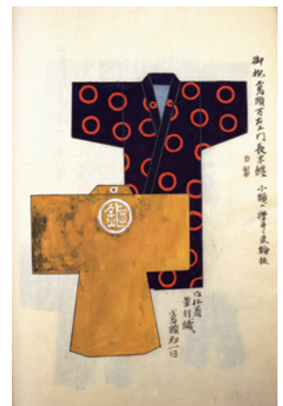
図9 同 御抱鳶頭万右エ門長半纏