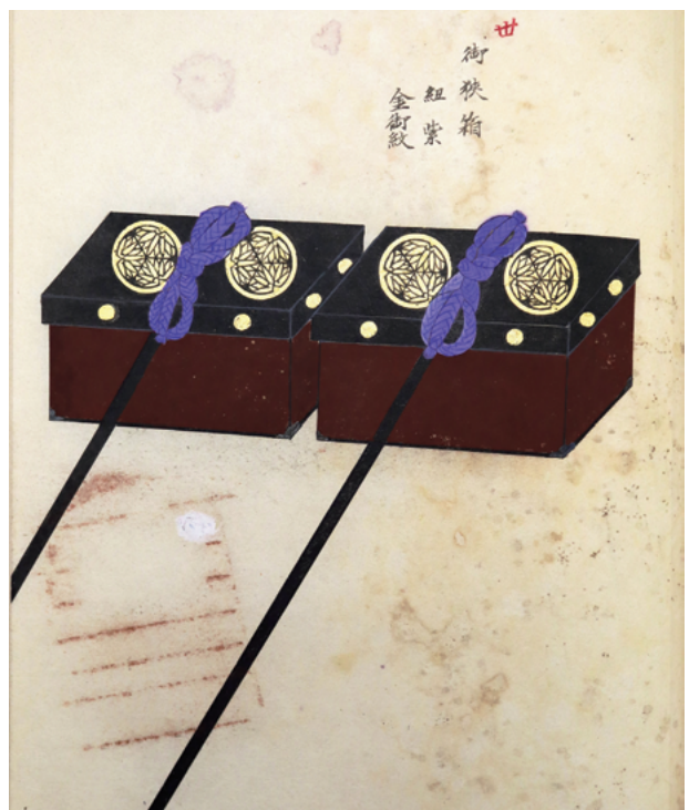
図3 同 御挟箱