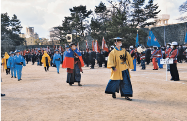
図10 和歌山市消防出初式 火消行列再現