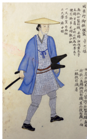
図4 同 歩行御供服装