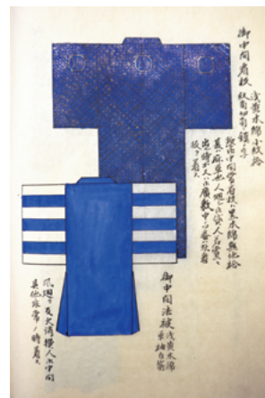
図8 同 御中間看板