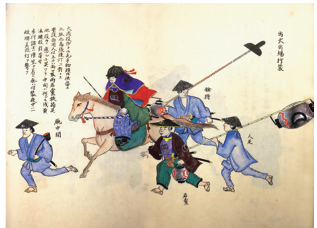
図7 『南紀徳川史』「卷之百四十九 服制第三 服飾図式」出火出場行装