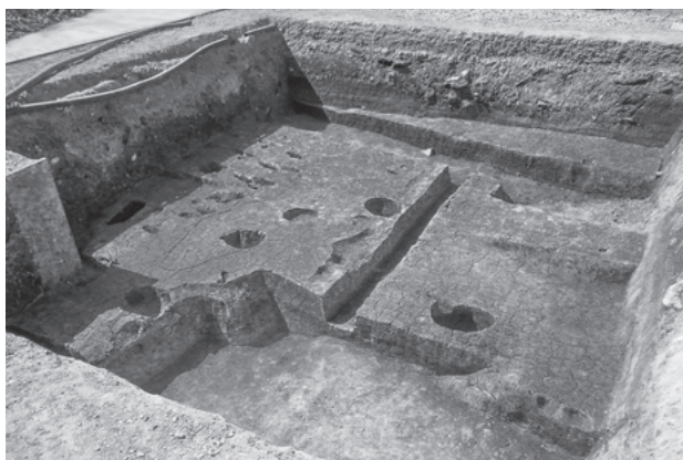
図255 第588次調査区全景（南東から）

柱穴および小穴を14基を検出した（図255・258）。遺構検出面の標高は68.9～69.0mである。柱穴および小穴の平面形は方形と円形があり、いずれも直径0.2～0.4m程