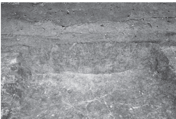
図259 SD3454堆積状況 (西から)

小穴SP3456 調査区中央部で検出した小穴。直径約0.2m、深さ約0.1mで、東西溝SD3454底面で検出した。