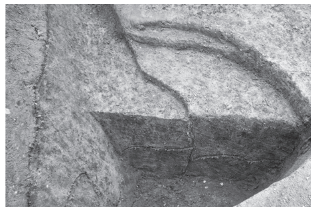
図257 柱穴SP3451断割（北から）

東西溝SD3454 調査区東半中央部で検出した東西溝。幅約1.1m、長さ約2.4m分を検出した（図258・259）。調査区中央部でとぎれており、西には続かない。深さは、今