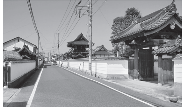
図58 寺町（調査地区中央部）の町並み