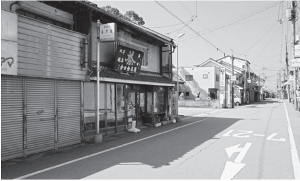
図56 宮脇町（調査地区東部）の町並み