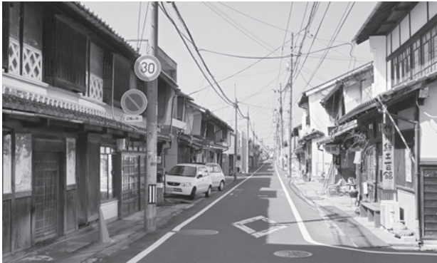
図57 西今町（調査地区中央部）の町並み