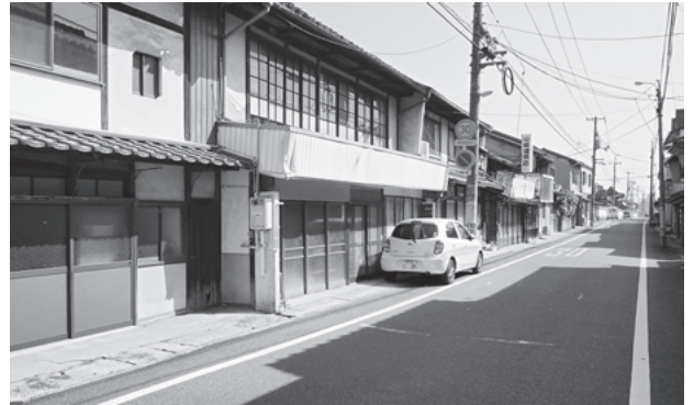
図59 安岡町（調査地区西部）の町並み

代以降も商業地として繁栄し、現在でも商店が並び、伝統形式で建てられた町家が比較的良く残り、城下町建設にともなって配置された徳守神社の社地とあいまって、旧城下町としての歴史的景観を伝えている。