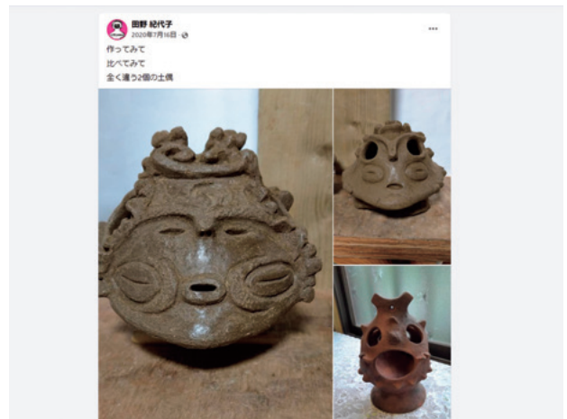
写真7 花積土偶（右上）の模造製作のSNS投稿

部を代替することはできないが、自由に全体像を把握できること、一度に多人数でアクセス可能なこと、一か所から複数のデータにアクセス可能なこと、などの3Dデータの特徴は博物館や学校などの教育・学習における各自の能動的な活動のできることの選択肢を増やすことに直結している。