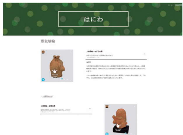
写真4 埴輪のページ

ほかにも、「コンセプトは博物館のミッションを明確にするために欠かせない」、「3D 化することによって普段の展示では見ることの出来ない部分を取り扱うことができた」などの感想も得られており、「収蔵資料の特性を理解し、展示・解説することができる」という本科目の到達目標は達成することができた。