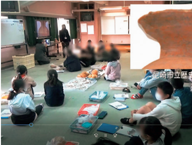
写真5 尼崎市立下坂部小学校での実践

開データ作成のため事前打ち合わせ時に写真撮影し、3D化した。しかし、弥生土器の場合、口縁部から強く屈曲する頸部を経て胴部までの部分に文様が描かれており、一方向からの展開データ化は不可能であった。そこで、授業当日は3Dデータを直接示して、文様の様子を伝えた(写真5 3) )。ワークショップは2021年度は春日部市郷土資料館、蓮田市立平野中学校などでも実施し、それぞれ同資料館、蓮田市文化財展示館の協力を得て、3D化して展開データを作成した。後者の実践では、プリントアウトした文様展開データのほか、GIGA スクール構想によって配布されたタブレットを用いて3Dデータを参照できるようにもしている 4) 。