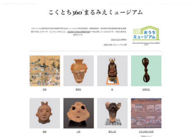
写真3 こくとち360°まるみえミュージアム

置づけについて調べ、3Dの特徴を活かして資料そのものと向き合う中で、一般向けの解説文やクイズなどの教育コンテンツを作成する。Google サイト上に特設サイトを立ち上げ、参考館のアカウントで Sketchfab 上に 3D データを公開したものをページ内に埋め込み、学生がその解説を作成するという形となり、9月末に公開した。例えば、埴輪のページでは、人物・動物・円筒の各種4点を選び、解説代わりにクイズを出題し、クリックすると解説が見られるようにしている。学生のレポートには「幅広い年代の人たちに歴史を知ってもらい、一般の人たちに向けた基本的な解説を重視したコンセプトのもと作成した」「簡単なクイズを解説の前に書くことによって、ただ流し見をするのではなく、“何故、このようなものが作られたのか”を考える」「形象埴輪、円筒埴輪と分けることにより埴輪の種類について知ってもらう」「3D コンテンツにすることで、質感や資料の後側などを見てもらい、写真だけでは伝わりづらい凹凸を見てもらい」などを意識したことが報告されている。